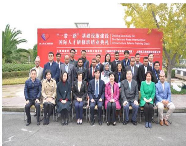
“一带一路”基础建设国际人才研修班