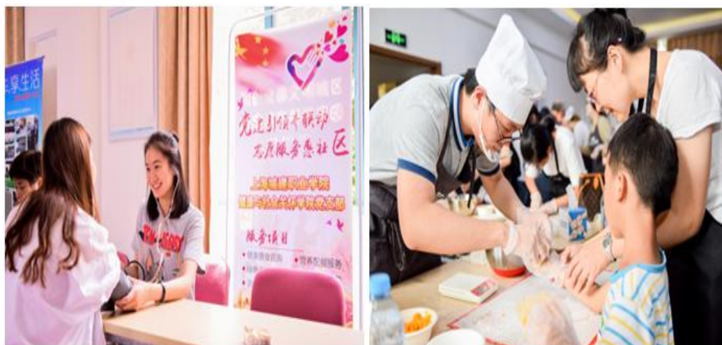
党建带团建，社区志愿服务