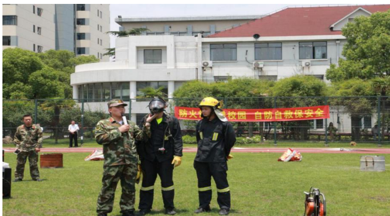
学校组织学生进行消防演练

学校始终坚持以安全教育全覆盖为先导性保障，通过易班平台、广播台，网络论坛、社交平台、微信公众号、手机应用等新媒体与传统渠道相结合的传播方式，加强宣传阵地建设，提升学校信息传播质量，师生员工对平安创建活动的知晓率和参与率达96%，使安全意识深入广大师生的内心。