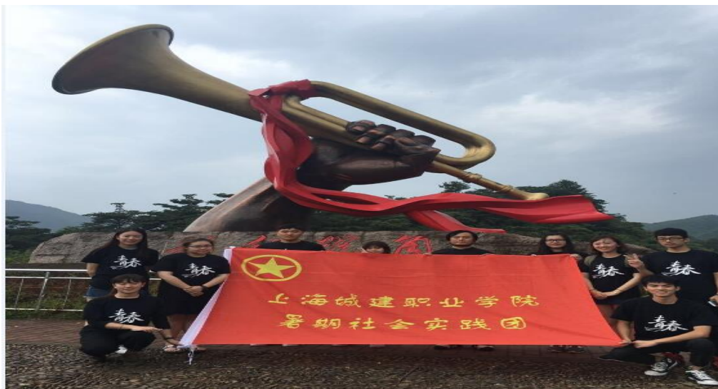
学生暑期社会实践