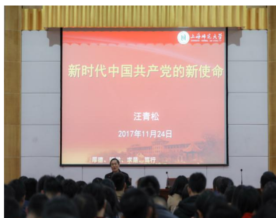
十九大精神宣讲报告会