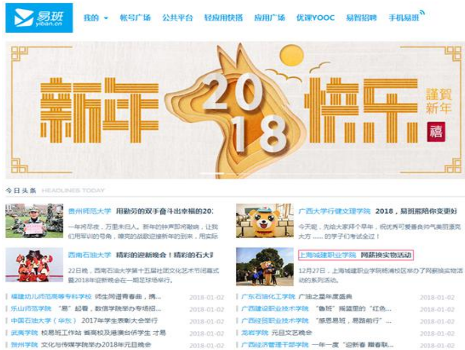
我校易班新闻荣登教育部易班网头条

校园舆论的重要阵地，把思政教育融入在学生喜闻乐见的主题活动中。2017年，继我校“易班带你嗨”迎新落地活动、学校首届大学生运动会、业余舞龙大赛首届“城建杯”完美落幕等活动报道新闻稿冲上教育部易班网首页之后，杨浦校区举办的网薪换实物活动的报道再一次荣登教育部易班网头条。