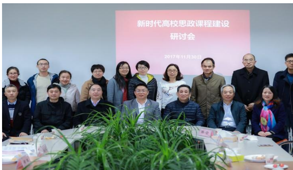
新时代高校思政课程建设研讨会

学校成立了思政教研部，现有专任教师 13 人，其中副教授 4 人，讲师 9 人，全部具有硕士以上学位，其中博士学位 2 人，硕士学位或研究生历 11 人，另有校内兼职教师 7 人。学校制订了马克思主义理论学科建设方案，通过内培外引，加强团队建设，通过多层次培训，提高师资队伍素质和水平；通过教育教学课题研究带动课程建设再上新台阶，同时注重与兄弟院校的交流学习与内部研讨学习。狠抓思政课集体备课制度的落实，专业教师队伍建设取得明显成效。1 人获聘上海市高职高专思政课教学指导委员会委员，1 人荣获上海市高职高专思政课教学比赛一等奖；1 人获得上海市首届高职高专思想政治理论课教师“教学标兵”称号；1 人获得上海市首届高职高专思想政治理论课教师“教学骨干”称号。学校思政教研部主任遂改副教授在《东方教育时报》撰写《推动十九大精神如脑入心化形》的学习体会。