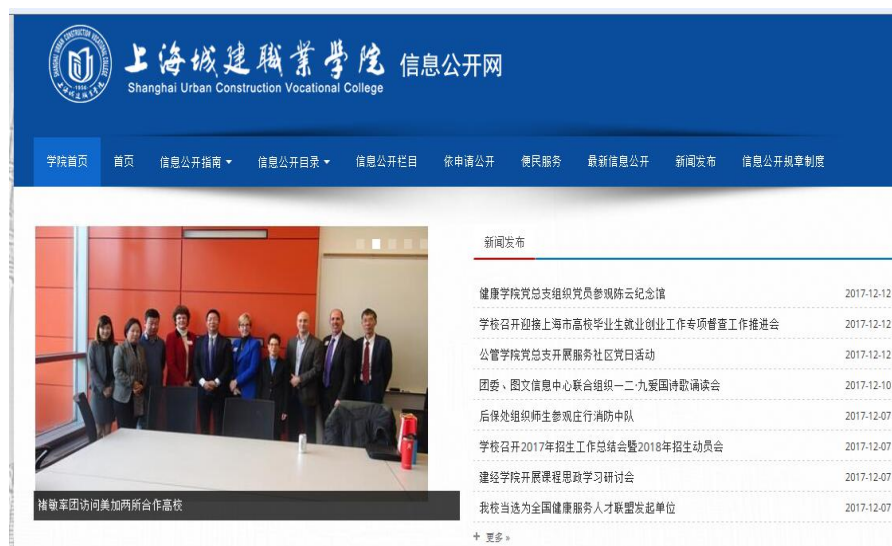
学校信息公开网页

学校建立信息公开工作长效机制。根据上海市教委《2016-2017年度上海高校信息公开评议工作实施方案》，成立了信息公开领导小组，制定了《上海城建职业学院信息公开实施细则》，建设了“信息公开”网站，各职能部门和二级学院均有信息员负责信息公开内容，以确保学院信息公开内容的及时和有效。