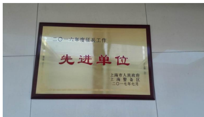
学校获评上海市 2016 年度征兵工作先进单位