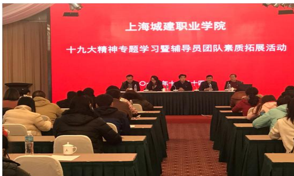
辅导员团队素质拓展

学校加强对辅导员队伍的培训。2016-2017年，选派7名辅导员参加市教委专题培训共10次，与北森生涯（北京）教育科技有限公司、上海东方绿舟企业管理有限公司分别签订协议，联合开展专题培训及素质拓展训练活动，提升辅导员队伍的政治理论素养、工作技能及研究创新能力。