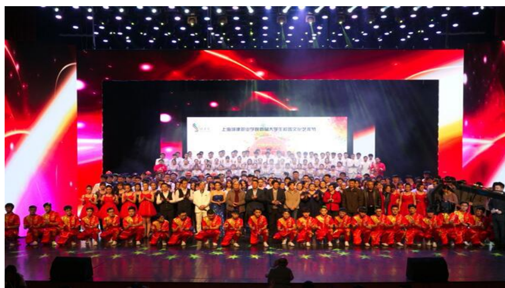
学校首届校园文化艺术节闭幕式

学校注重打造校园文化品牌，试点实施具有联动机制的“文化导师导航+人文素养课程学习+职业素质拓展训练+文化活动体验”文化素质育人工程、着力推进“城”字品牌社团建设、第二课堂创新创业教育平台建设，打造富有学校特色的校园文化品牌。