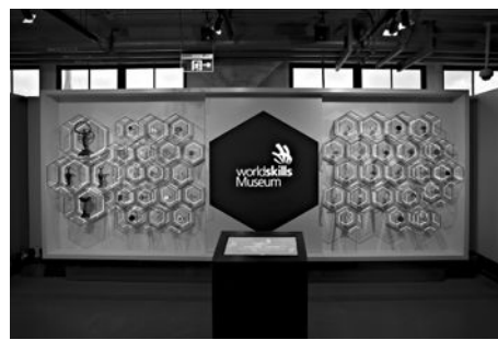
世界技能博物馆。